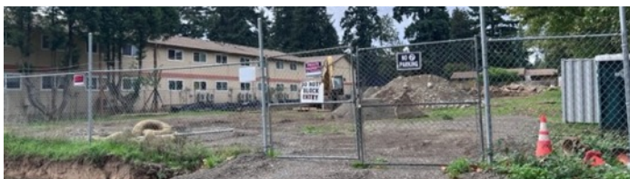
Cedar Tree Apartments, 643 NE 162nd Ave. Land clearing underway

Planificar caso DR-21-00616 Aplicado 11/05/2021 (Wilkes East NA) Construcción de la fase 1 de un edificio metálico prediseñado de aproximadamente 26,000 pies cuadrados para las nuevas instalaciones de Ditch Witch de Pape Machinery ubicadas en 17217 NE Sandy Blvd. Esto se encuentra en una propiedad de 11 acres adyacente a la histórica Casa Zimmerman. Debido a las limitaciones del sitio, se propone eliminar todos los árboles regulados. El informe de Gresham Wetland indica que no hay humedales en esta propiedad. La fase 2 incluirá una segunda instalación de maquinaria papelera..