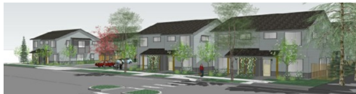
Habitat for Humanity new housing, 17616 NE Glisan. Architectural drawing

ACTUALIZACIÓN: La revisión de diseño DR-023-00425 se envió en línea a la ciudad de Gresham el 14/7/2023. La división de Planificación envió un aviso de solicitud de uso de suelo incompleta el 4/8/2023 solicitando más información.